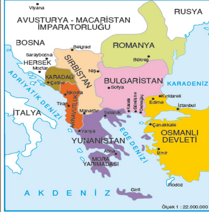
II. Balkan Savaşı sonrasında Balkanlar